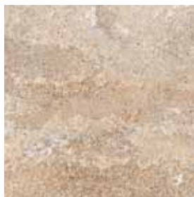
8031, 30 x 30 cm R 10