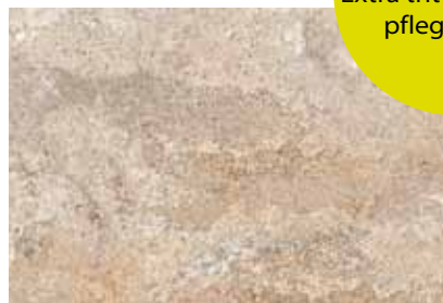
8045, 30 x 45 cm R 10

Hardglaze 3.0 Extra trittsicher und pflegeleicht.